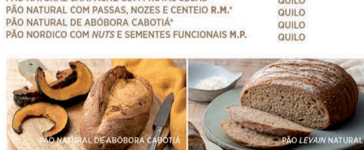
PÃO NATURAL DE ABÓBORA CABOTIA PÃO LEVAIN NATURAL PÃO BATARD DE CENTEIO COM NOZES PÃO DE LINGÜICA PORTUGUESA COM SÊMOLA DE TRIGO